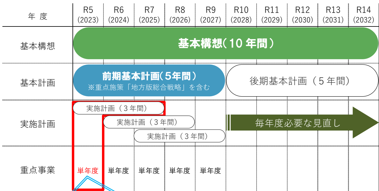
■第5次飛島村総合計画と評価関連

「第2期飛島村地方版総合戦略」は、まち・ひと・しごと創生法に基づく地方版総合戦略であり、総合計画における重点施策としての位置づけを併せ持っています。重点施策については、令和9年度の目標値である重要業績評価指標（KPI）を達成するため、単年度ごとに進捗管理をし、その評価については実施計画の評価とも連動しています。また、4半期ごとに管理する重点事業シートで管理することで、より実効性を高めています。さらに、これらの結果については、次年度の予算編成とも連動させています。