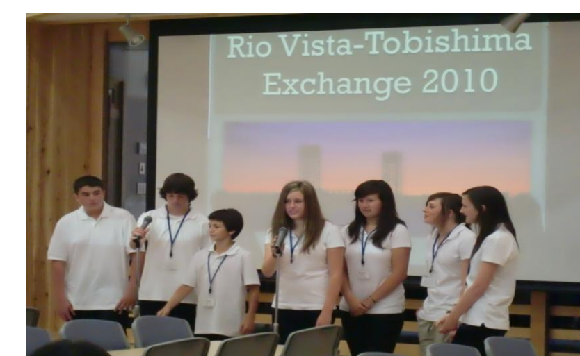
リオビスタからのプレゼンテーション