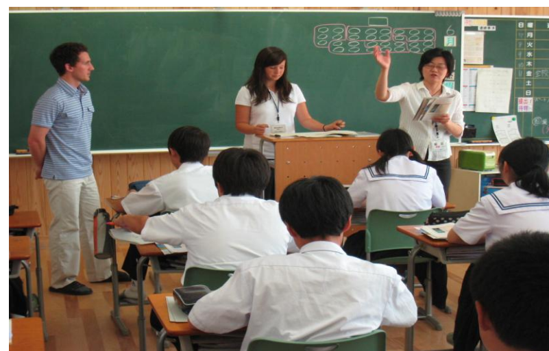
英語授業 (リスニング)