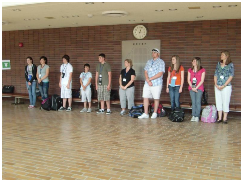
ホストファミリーとの対面

平成22年6月10日（木）～14日（月）まで、姉妹都市提携を結んでいるリオビスタ市から10名の交流団が来村されました。 滞在中、ホームステイや夕食会、飛島学園1日体験など、様々な交流を深めました。