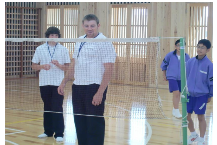
体育授業 (ビーチボールバレー)