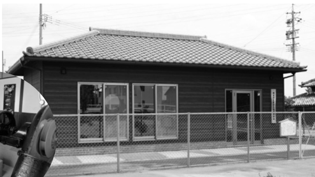
↑大宝排水機場保存館