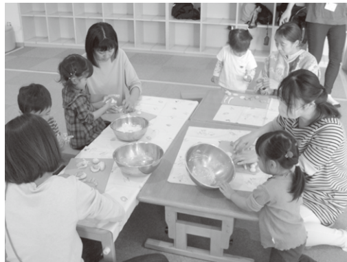
～じどうかんであそぼ!～ 小麦粉粘土であそんだよ♪