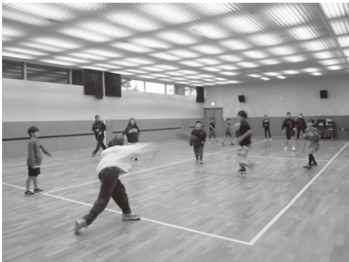
～わくわくチャレンジ～ 大盛り上がりのドッチボール♪