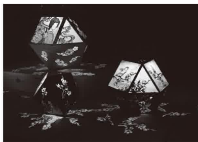
希莉光(ぎりこ)あかり