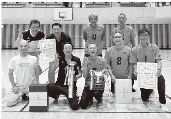
●問合せ先 中央公民館内生涯教育課