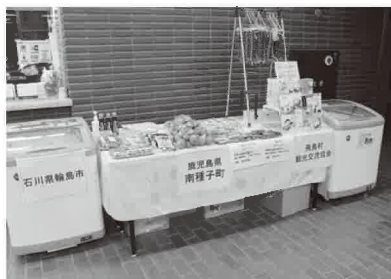
ナイトマーケット