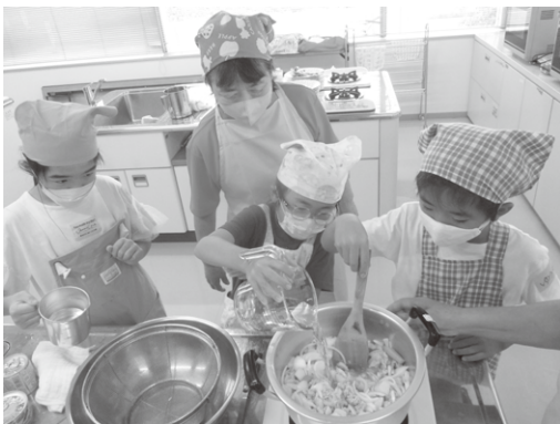
～お昼ご飯を作ってみよう～ カレーライスに挑戦!