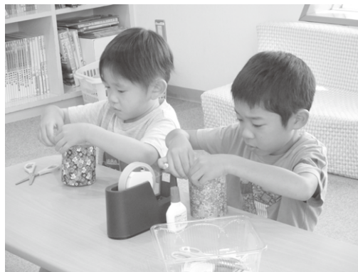
プレゼント作り♪がんばるぞー!