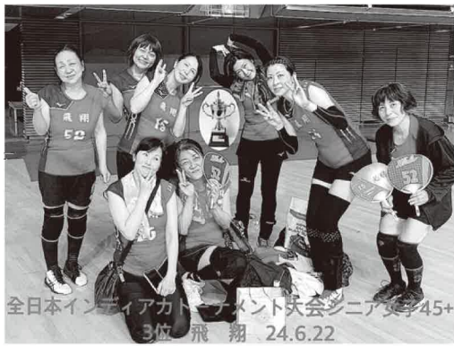
全日本インディアカトーナメント大会シニア女子45+ 3位 飛翔 24.6.22

インディアカは誰でもできるスポーツです。インディアカ協会では会員、体験参加者を募集しています。