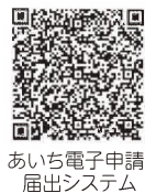
あいち電子申請届出システム