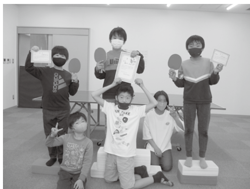
卓球大会(3・4年生の部)