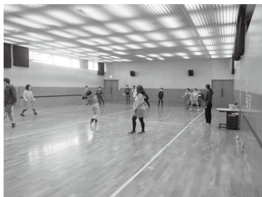
「6年生の集い」でのドッジボール

※状況により事業が中止となる場合があります。詳細は村公式ホームページをご覧ください。直接お問合せください。