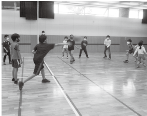
わくわくチャレンジ