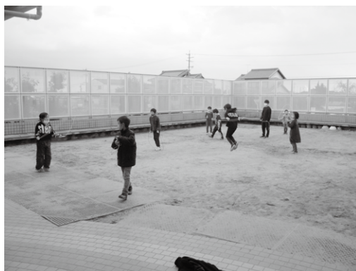
なわとびを頑張っています