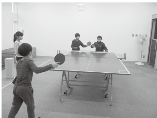
卓球を楽しんでいます