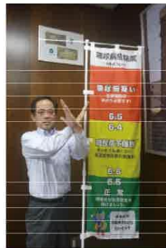
▲「ストップ ザ 糖尿病」PR

住民課、福祉課と連携して、住民が自ら「健康増進」「疾病予防」に取り組むことを目指し、生活習慣病の発症および重症化予防に取り組めます。