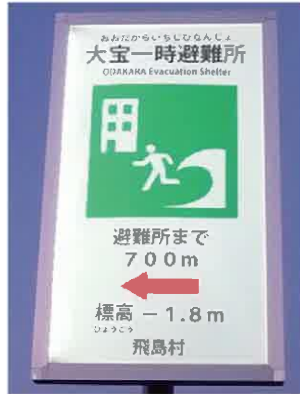
▲避難所看板(夕方に撮影)