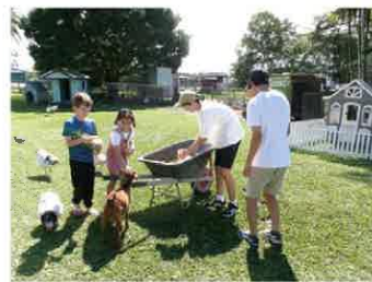
▲令和5年度海外派遣事業(オーストラリア)

交流やホームステイなど、外国の文化、歴史、習慣等に直接触れることにより、異文化との共生、協調の重要性を学び、国際社会で活躍する人材育成および語学力向上を図ります。行き先は、オーストラリアのケアンズを予定しています。