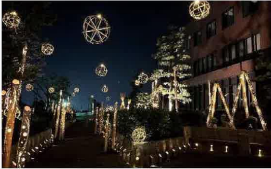
令和5年度トビシマライツ