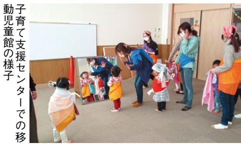
子育て支援センターでの移動児童館の様子

今回、妊産婦と未就園児を対象にしたのは第一段階で、制度設計を行い、次は移動手段のない方に対し、対象者を絞って次の段階を考えていきたいと思えます。