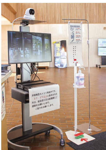
コロナ予防の一つ、役場玄関にある検温カメラと消毒液

の安心につなげることを全力で取り組んでまいります。また、地域社会への影響に対しても住民ニーズや状況に加え、国のワクチン接種の時期なども見極めながら必要な生活支援対策を積極的に実施していきたいと考えます。