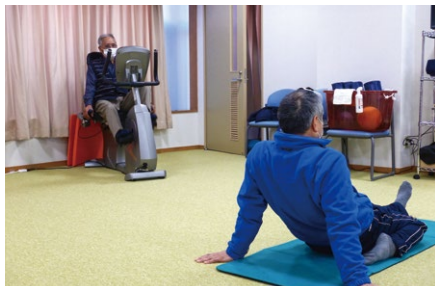
介護予防の一つである実践室とトレパチ

当然のことながら、介護保険料の算定では、介護給付費の実績、及び今後の推移を勘案しながら慎重に推計する必要があります。増大する介護需要に応えつつ、基金から