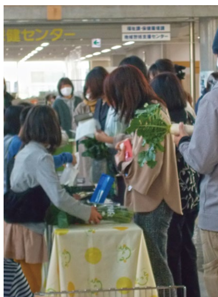
産直市で野菜を販売する生徒たち

予定していることは、各学期に1回ほど、減農薬野菜を使用した給食を提供していきたいと考えています。できれば、無添加食材も極力使うような形で給食を整えることで、子どもたちの食に対する関心が高まると思いますので、推進していきたいと考えています。