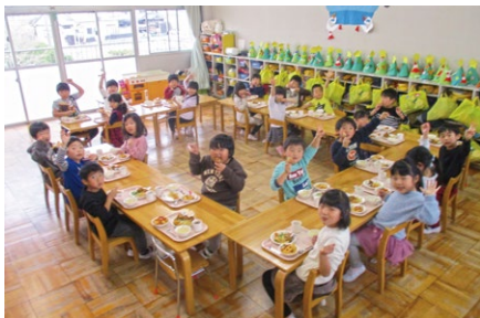
保育をうける子どもたち

しかしながら、私的契 約児に関する取り扱いは、 法を補完する制度、受け 皿として、保護者の皆様 が利用する施設を選択で