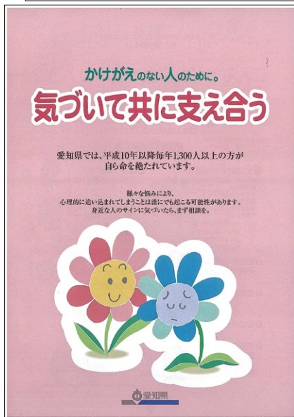
自殺予防対策の啓発パンフレットとグッズ