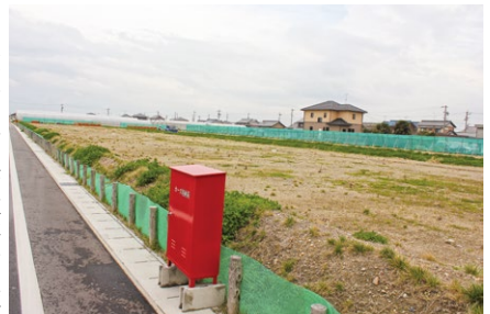
第1次住宅地開発地(造成当時)