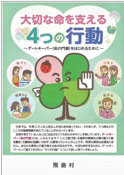
ゲートキーパーについて