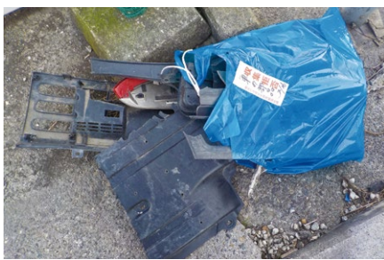
収集されなかった事業ごみ