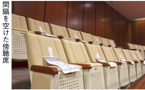
間隔を空けた傍聴席