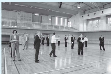
空調が効くまで1時間かかるが使用料はかからない