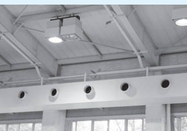
天井を走るパイプから出る吹出口

前号では輻射式空調の体育館を視察した件を掲載しましたが、今回は後付けの対流式空調設備を採用している名古屋守山区の志段味スポーツランド体育館を見せていただきました。