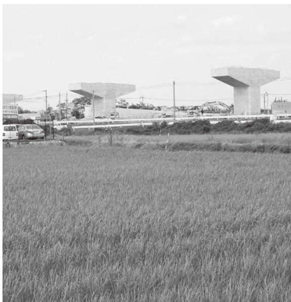
梅之郷地区の農用地

村としては、平成32年度に都市計画マスタープランの見直しを考慮しており、両地区土地利用についても、これら工事の進捗をふまえながら計画を策定していきたいと考えています。