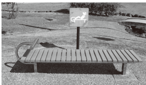
健康遊具はあるが…

○村長 健康の森の利用者は少ないのが現状です。その原因として、遊具等の使用方法が分からないとのこと指摘もありましたので、今回補正予算を計上して健康の森の全体の看板、並びに遊具の使用説明と配置看板を設置し、利用環境の整備を図ります。