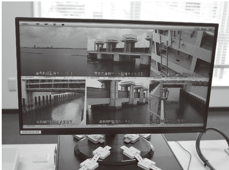
日光川排水機場の監視カメラ

答 ○総務部次長 平成29年度にスマートフォンサイズのタブレットを2台購入する予定です。