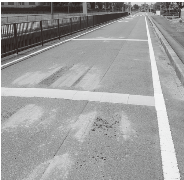
すこやかセンター南側のハンブ

今後は運転者のマナー、モラルにも積極的に訴えソフト対策も強化していきたいと考えます。