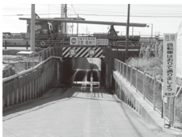
旧中学校東アンダーパス

今後は、より安全に地下道が利用頂けるような対策を検討していきたいと考えております。