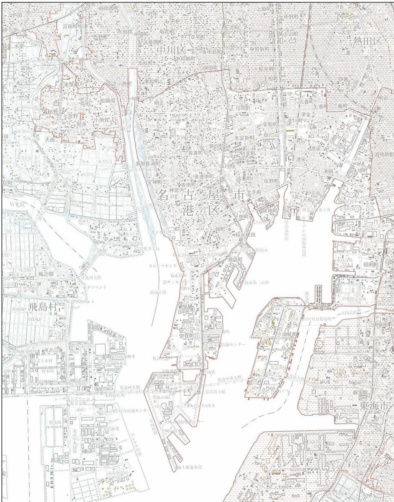
資料1 - 2 : 飛島村 (名古屋市港区) における人口集中地区 (H22 国勢調査)