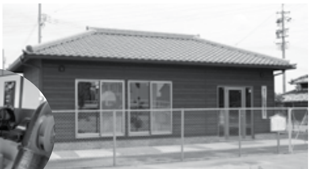
↑大宝排水機場保存館