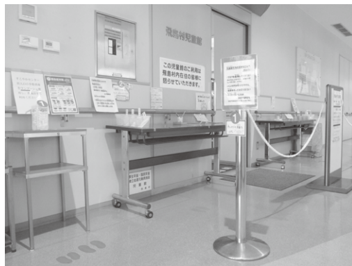
入館の仕方が変わりました