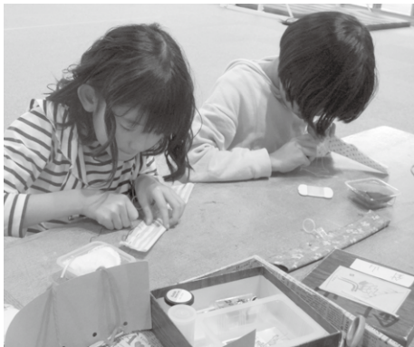
さいほうをしよう