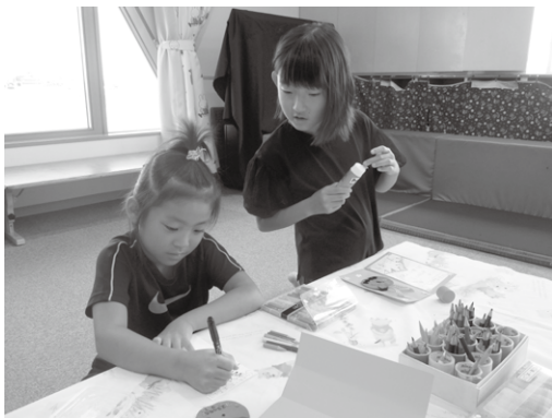
敬老の日プレゼント作り