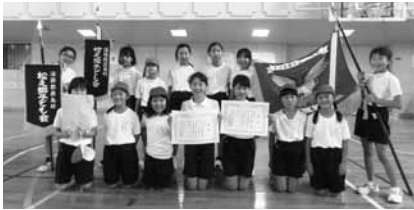
女子の部優勝 竹之郷・松之郷子ども会