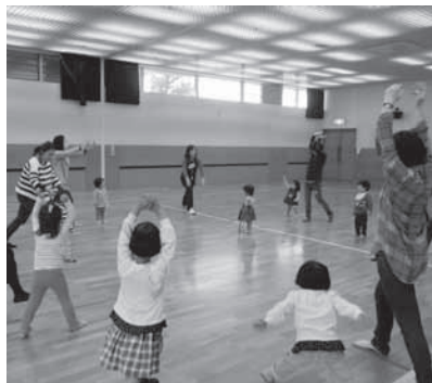
親子ふれあい運動あそび

9日(火) 育児相談日です。 臨時保育士の登録は随時受け付けています。 ●問合せ先 すこやかセンター内保健福祉課