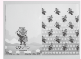
クリアファイル (A4サイズ) 1枚 70円