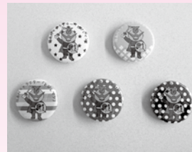
缶バッジ 5種 1個 50円