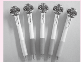
ボールペン(黒) 5種 1本 180円