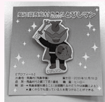
ピンバッジ 1個 220円