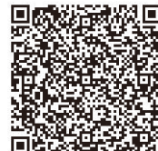
スマートフォン用

総務部企画課 FAX:0567-52-0089 (電話番号・メールアドレスは広報裏表紙に記載)