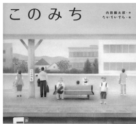
なんでもないみちだけど。 いちばん あるいてきたいみち。 なんども なんども あるいてきたいみち。

みちはいくつもあるけれど、おばあちゃんのいえにつづく、ほくのだいな、このみち。ありがとうの気持ちを伝えた。