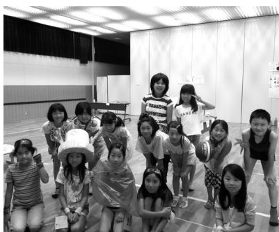
夏まつり実行委員会