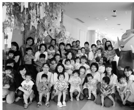
パオパオキッズ七夕会