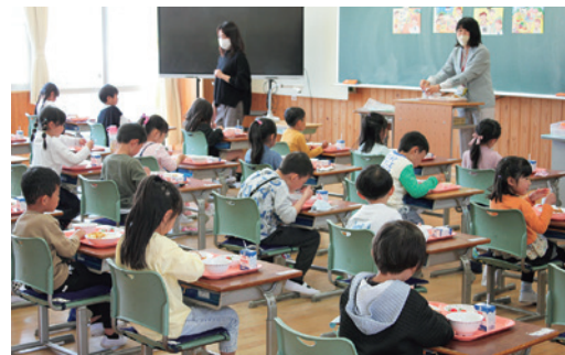
◀ 飛島学園前期課程 給食風景