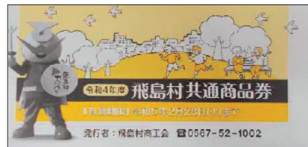
▲令和4年度 プレミアム付き商品券

令和5年度においても、昨年度に引き続き、プレミアム率を20%とし、4,000冊を発行します。