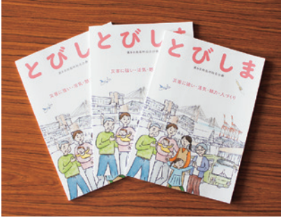
第5次飛島村総合計画ガイドブック