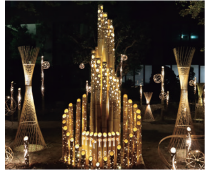
令和4年度 トビシマライツ