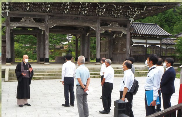
大本山總持寺祖院