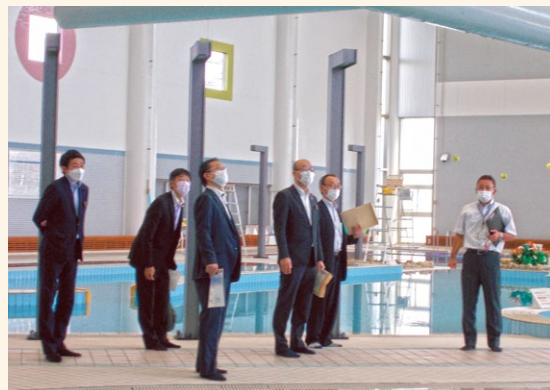
すこやかセンター