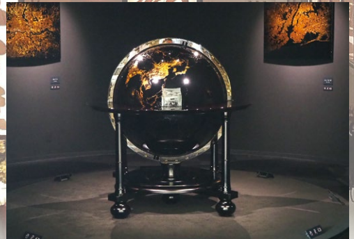
輪島塗大型地球儀