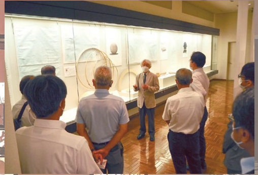
石川県輪島漆芸美術館