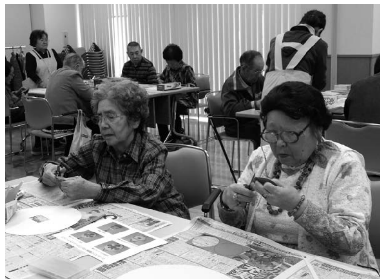
社会福祉協議会 生きがい活動支援事業（さくらの会 ティッシュBOX作り）

答 飛鳥村の全村民です。社会福祉協議会が主催であるのに老人クラブ員しか参加できない行事がある。以前は参加することができた。特定団体に所属している人だけを対象にした事業は間違っていると思うし、そうであればその分の補助はやめるべきだ。