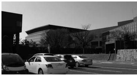
総合体育館と中央公民館

答 総務省より公共施設等の維持、耐久性について調査をし、計画的で適正な財政負担をするという指針が出されている。そのため公共施設の調査に係る委託と総合管理計画の策定を総務省の要請に合わせて実施する。