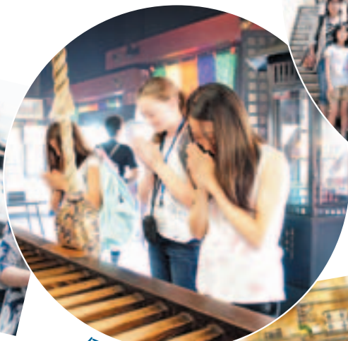
何を願っているのかな?