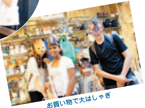
お買い物で大はしゃぎ