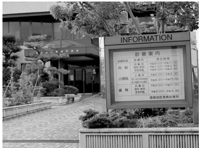
海部地区急病診療所