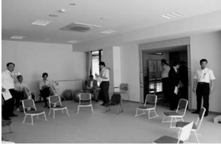
敬老センター運動実践室