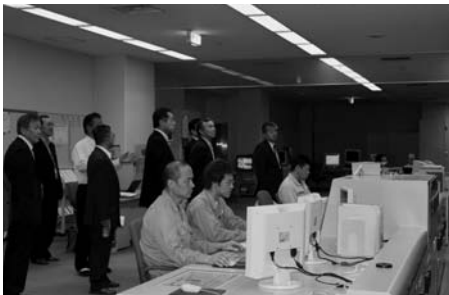
八穂クリーンセンター中央制御室